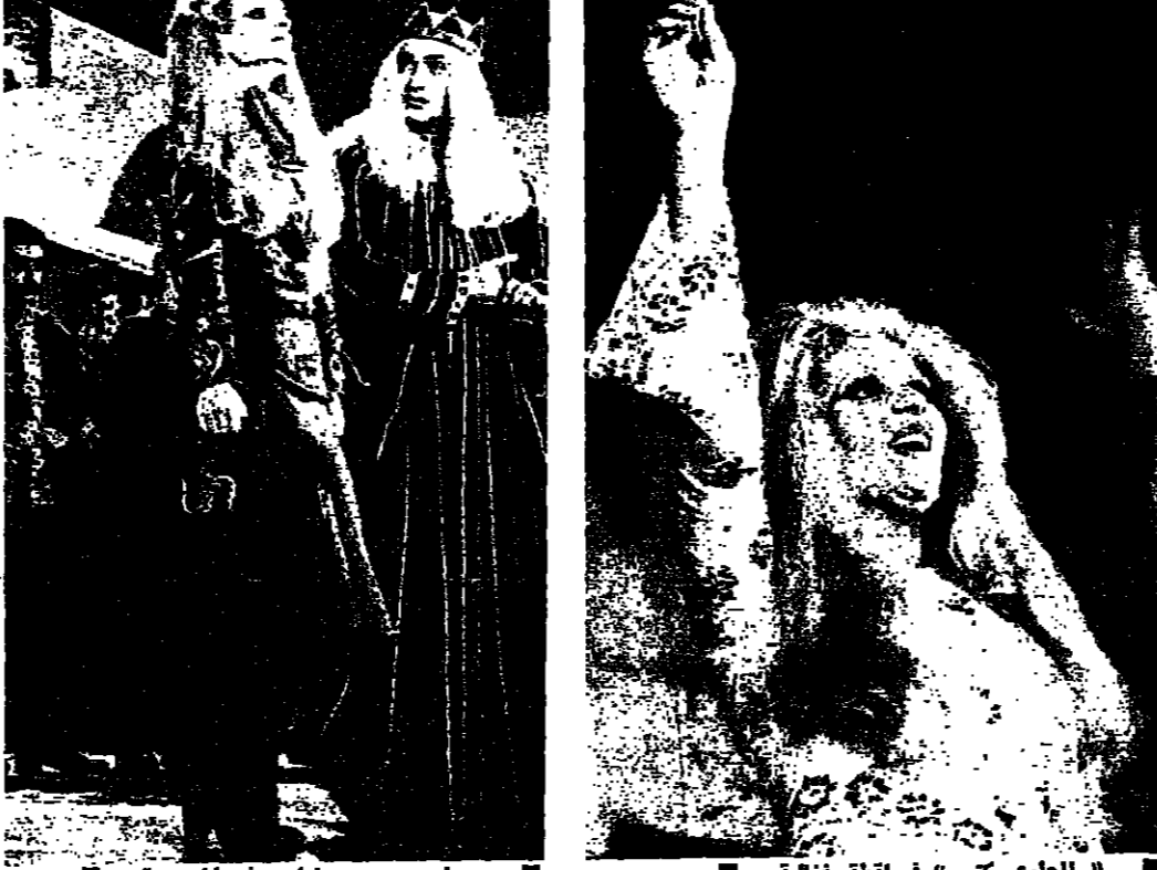
صباح ووسيم طيارة في المسرحية